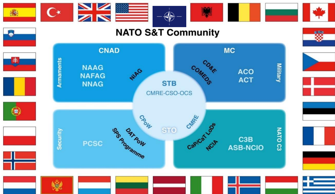
Figure 1 : Communauté scientifique et technologique de l'OTAN

19. La gouvernance unifiée de cette communauté est assurée par le Comité OTAN pour la science et la technologie (STB) , composé de représentants des pays et des partenaires de l'OTAN dans le domaine scientifique et technologique. Le STB est présidé par le conseiller scientifique de l'OTAN, assisté de deux vice-présidents du secrétariat international et de l'état-major militaire international. Il assure la cohérence de l'action de l'OTAN dans le domaine scientifique et technologique au moyen d'objectifs définis dans la stratégie OTAN pour la science et la technologie, axe ses travaux sur les priorités scientifiques et technologiques à moyen terme de l'OTAN (voir le tableau 3) et sert de point de contact pour l'ensemble des programmes de travail de l'OTAN dans le domaine scientifique et technologique.